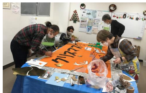
「はたらっく・ざま」

5月 フォーラム「困窮者支援から見える問題・課題解決に向けて～非営利・協同の役割を考える～」